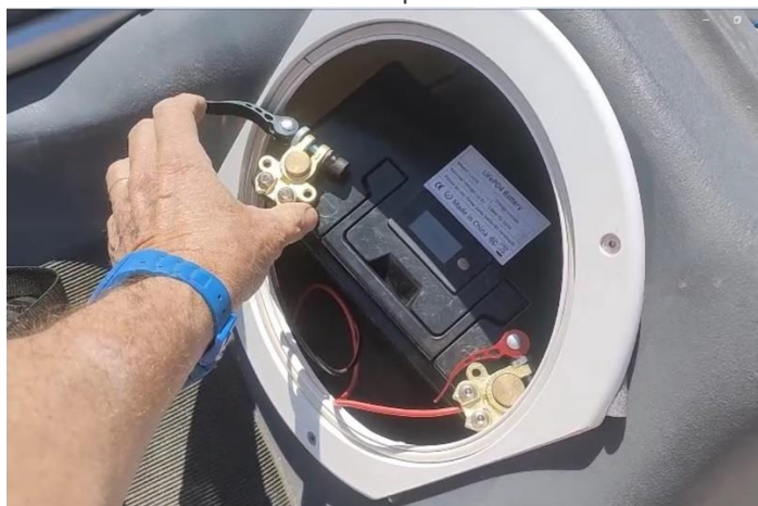
Batterie dans un compartiment étanche